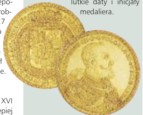
C? ., 8+20, 9:6+; 2( :6= ( ?06: ( 465, : ( ' >. 4; 5: ( III

Wymiana handlowa z Europą Zachodnią owocowała napływem złota do Polski. Kruszc ten pozwalał bić dużo dukatów i ich wielokrotności. Wtedy właśnie wybito największą polską monetę o nominale aż stu dukatów. Ów złoty kolos wybito w Bydgoszczy w 1621 roku miał średnicę 69 mm oraz ważył 348,32 g! Tym samym stemplem wybito dukaty o mniejszych nominałach (40 – 90 dukatów). Ponieważ miały tę samą średnicę, odpowiednią wartość nadawano im poprzez zwiększanie grubości krążka. Twórcą tych wspaniałych monet był najwybitniejszy reprezentant mnieryzmu w polskim medalierstwie, Szwajcar Samuel Ammon, pracujący w mennicach w Gdańsku i Bydgoszczy. Ammon tworzył monety nie tylko z wielką dbałością o szczegóły i ozdoby, ale również bawił się formą. Oko uzbrojone w lupę dostrzeże na jego monetach ma- lutkie daty i inicjały medaliera.