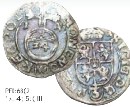
PFD:68(2 ' >. 4; 5: ( III

srebra, bo o wartości jedynie nieco powyżej grosza. Ze względu na tę niską jakość kruszcu oraz łudzące podobieństwo do groszy cesarskich przy-