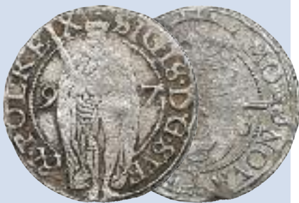
! ? =, +220, G8, ' >. 4; 5: ( III 1(26 28F3( 9? =, +220, . 6

Zygmunt III krótko zasiadał na szwedzkim tronie. Śladem po tym panowaniu są bite w mennicy sztokholmskiej talary, półtalary, marki, półmarki oraz wielokrotności i części öre. Na wszystkich tych monetach znajdowała się podwójna tytulatura Zygmunta – jako króla Szwecji i Polski. Po jego detronizacji rozpoczęły się wieloletnie wojny o odzyskanie szwedzkiego tronu. Ze zmagają zwycięsko wyszli Szwedzi, zajmując m.in. Inflanty z Rygą. Natychmiast uruchomili tam mennicę, w której bito szelągi z bardzo lichego srebra. Podobnie było w zajęтым Elblągu. Gustaw II Adolf rozpoczął tam produkcję drobnych monet łudzaco podobnych do polskich koronnych oraz gdańskich, ale ze znacznie gorszego srebra. Monety zalały sąsiedni Gdańsk oraz przedostawały się na pozostałe tereny Polski. Z tego też względu ich obieg został zakazany w Prusach i w Polsce. Sejm koronacyjny w 1633 roku uchwalił: &eb monet !#ej elbi$skiej, r skiej i ins!ej cud!o!iemskiej do Pa$stw nas! ch nie pr! jmowano ale j" gubiono i w nis!c!ano.