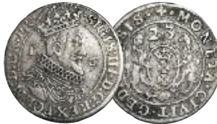
O8: . + (E920 ' >. 4; 5: ( III. P6*?A:26=6 465, : ( : ( 7690 (+ (0( = (8:6HB 10 . 8, ? *?(9, 4 ?(H ; ?>92(0( = (8:6HB 17, ( 7FI50, 118 . 8

puszczać można, iż celem emisji było wyeksportowanie tego pieniądza do Niemiec i wykupienie za niego lepszej monety. Podobnie na użytek handlu ze Śląskiem wybijano w latach 1615 – 1618 tzw. 3-krucierzówki, które odpowiadały wartością półtorakom. Trzecim nowym rodzajem pieniądza były orty. Po raz pierwszy wyemitował je Gdańsk w roku 1608. Wyjściowo