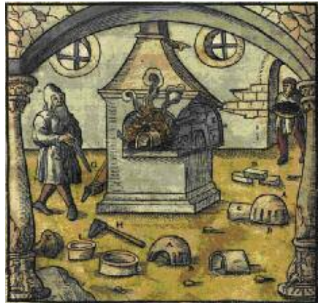
%5C:8?, 2; 150 ? +70, D( De Re Metallica libri XII, (: :689:=( G, 68. 0; 9 (A. 80*630

W XVI wieku wzrastała liczba i specjalizacja cechów. Jednocześnie ze względu na wprowadzane przez nie ograniczenia coraz więcej rzemieślników pracowało poza miastami, a tym samym